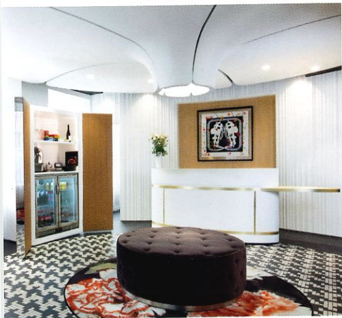
_DÈS LE LOBBY, VOUS PLONGEZ AU CŒUR D'UN UNIVERS DE RAFFINEMENT ET DE DÉLICATESSE. LA MOQUETTE «PIED DE POULE GÉANT» EST PARTICULIÈREMENT RÉUSSIE.

Casaque rose et casaque bleue pour une nuit gagnante !