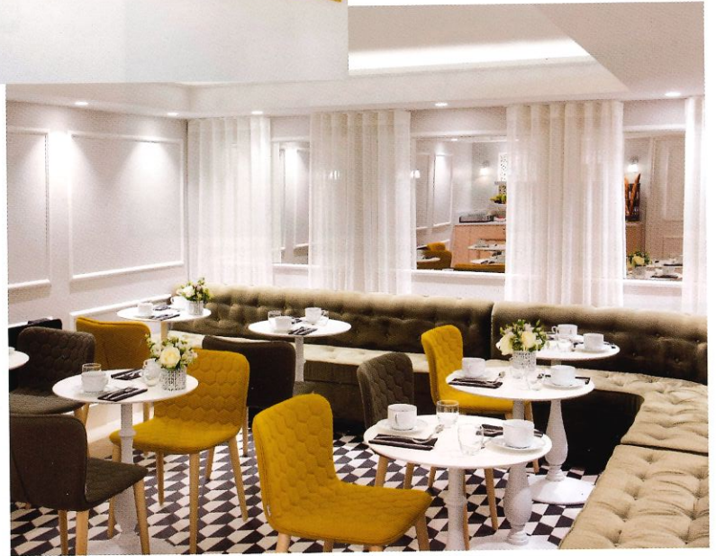
_PETIT DÉJEUNER DANS UNE AMBIANCE SÉRÈNE AU CONFORT ABSOLU.