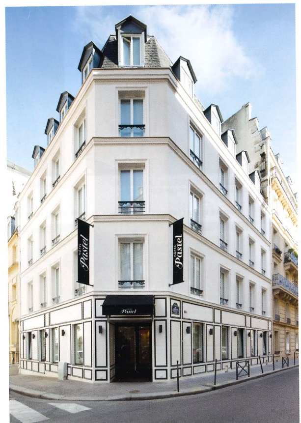
_SITUÉ DANS UN QUARTIER CONFIDENTIEL DE PARIS, CHARGÉ D'HISTOIRES, LE PASTEL, TOUT EN POÉSIE ET CHARMÉ DISCRET, EST ENGAGÉ DANS UNE DÉMARCHE ÉCO-RESPONSABLE.